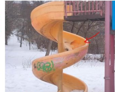
Брянская обл., Брянск, Звездный парк, ул. Проспект Ленина, д.1