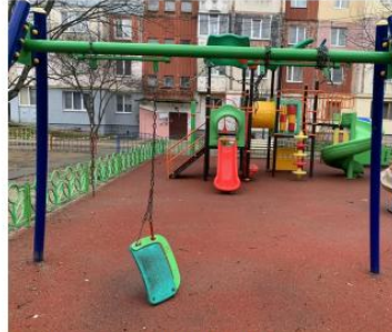
Республика Крым, Симферополь, ул. Проспект Победы, д.210

*Мониторинг технического состояния оборудования детских площадок, проведенного Детским Общественным советом при Минстрове России в 2022 году