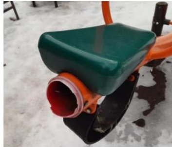
Москва, ул. Анненская, д.7