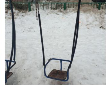
Москва, ул. Беловежская, д.39, к.5-к.6